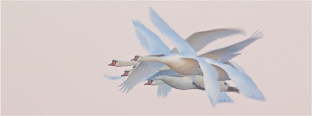
Knölsvanar uppträdde i rekordantal vid Tåkern hösten 2012.

på 630 ex. 17.3, en ovanligt låg siffra. Under våren inräknades 266 kullar på strandängarna. Vid höstens gåsräkningar inräknades som mest 18 200 ex. 15.9, nytt rekord för Tåkern! Höstens sista fågel försvann från sjön 25.11.