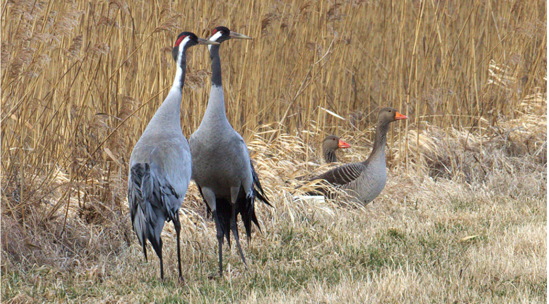
Det går bra för Tåkerns tranor och grågäss.