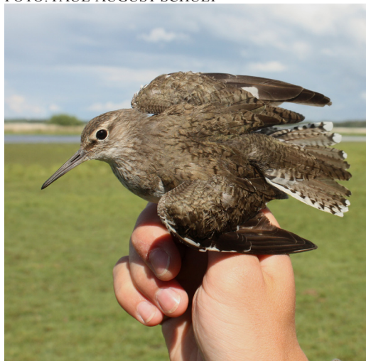
Några drillsnäppor ringmärktes vid Sjötuna under sommaren.