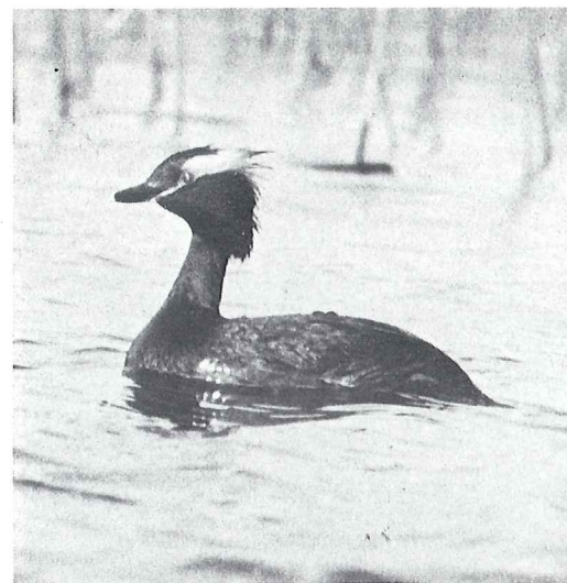
Häckningen går dåligt för några av Täkerns doppingarter. Bl.a. förefaller det som om gäddorna — "fågelsjöns krokodiler" — är ett hot mot de mindre doppingarna, t.ex. svarthakedopping.

Maximisiffran för gässen antecknades den 16 oktober och låg på ca 26 000. Båda de efterföljande helgerna noterades också många, men ca tiotusen färre. Den milda hösten fick gässen att dröja på Östgötaslätten ovanligt länge. Så sent som den 5 december var antalet omkring 5 000. Förutom de dominerande sädgässen sågs en del andra gäss, t.ex. spetsbergsgäss i oktober, med en största flock på 13 ex. I samma månad sågs också åtta vitkindade gäs. Dessutom noterades en familjegrupp av fjällgäss, för övrigt den första vid Täkern på 30 år. Tilläggs-