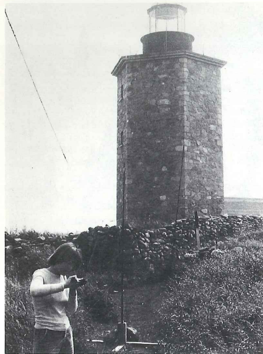
Eva Johansson vid ett nät. Nidingen i augusti 1981.

200 ex. Den stora avtappningen av flocken skedde i andra hälften av maj och den sista vårobservationen gjordes 15 juni. Höstens första skärnsnäppor dök upp igen den 10 oktober och sedan sågs ett mindre antal fram till säsongsslutet. Av höstens västliga stormar blev det inte så mycket som vanligt på västkusten och de som kom var sena. Pelagiska arter noterades därför i mycket blygsamma antal, som bäst 19 havssulor den 8 oktober. Endast tretåig mås förekom i större antal, vilket är vanligt vid sena stormar, med som mest uppskattningsvis 20 000—25 000 ex. den 2 november.