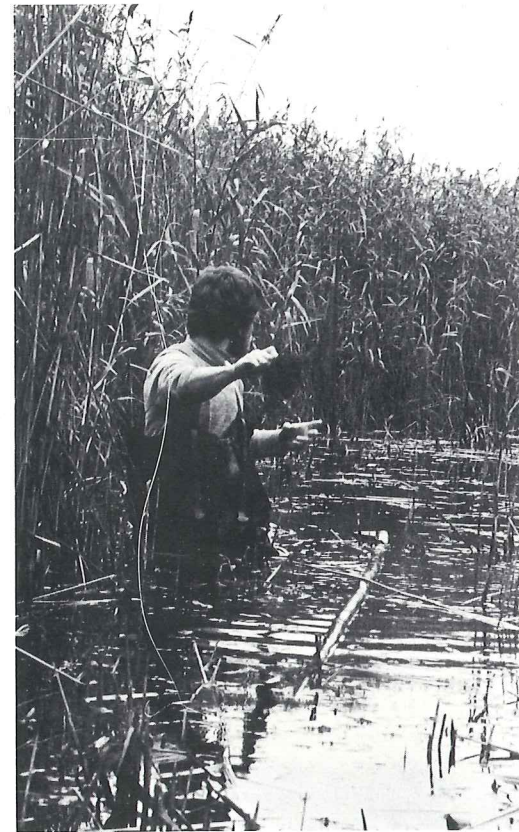
Nätfångst i Tåkernvassarna.

Liksom tidigare år fick föreningen ekonomisk hjälp av länsstyrelsen till vetenskapliga arbeten inom naturreservatet. Speciellt har undersökningar i vassläterytor prioriterats. Där har fältstationen arbetat tillsammans med universitetet i Linköping bl.a. med fauna- och floraeffekter samt bedrivit jämförande studier av slätterytter och oslagen vass. I de orörda vassbältena har punktruttinventeringarna fortsatt och vegetationskarteringar har också utförts. Av speciella ornitologiska projekt i vass kan nämnas studier av trastsångaren,